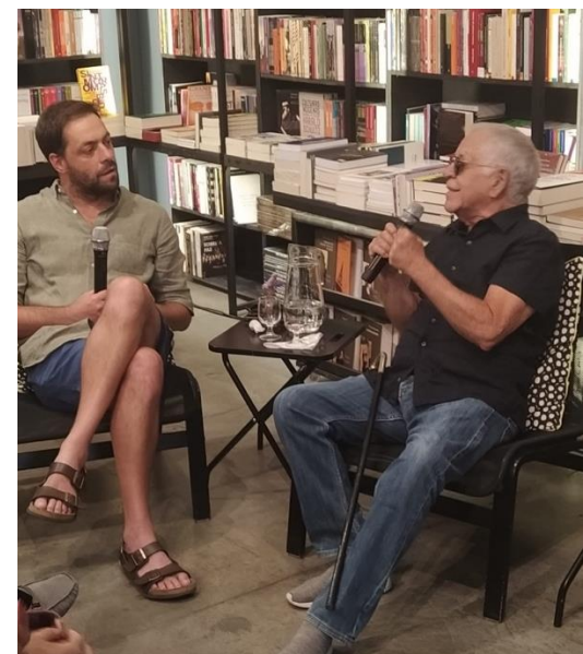
Dois rapazes de sorte: António Zambujo e Nelson Motta