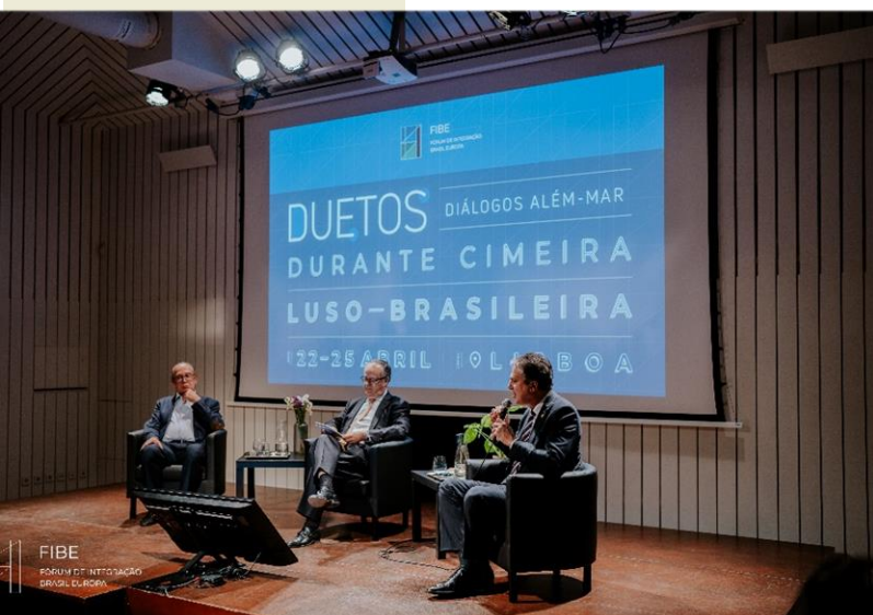
Duetos Durante a Cimeira: Abril de 2023