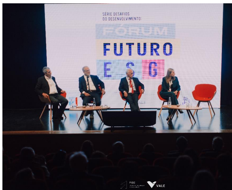
Fórum Futuro ESG: Novembro de 2023